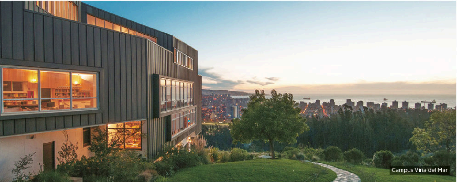
Campus Vina del Mar